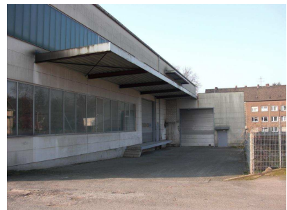
Ansicht Halle 6 + 7