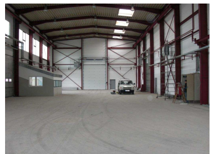
Innenansicht Halle 6