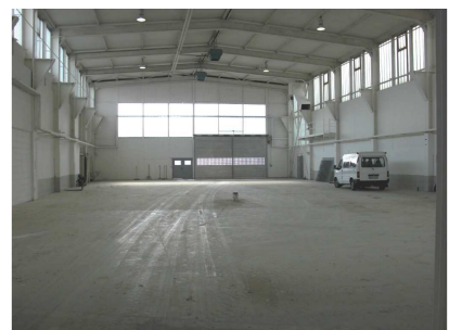
Innenansicht Halle 1