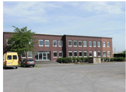
Ansicht Büro ( Gebäudeteil 3 )